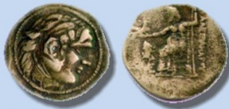
Tetradracma con efigie de Alejandro S.IV a.C.

En lo relativo a la creación literaria propiamente dicha, se continuó desarrollando el drama con la comedia nueva (Filemón y Menandro) y el mimo (Herodas). También aparecieron algunas epopeyas heroicas (Apolonio), así como poesía didáctica (Arato de Solos). En la lírica sobresalieron Teócrito, Calímaco, Cleantes y la poetisa Anite de Tegea (quien introdujo en la literatura el epigrama al animal muerto).